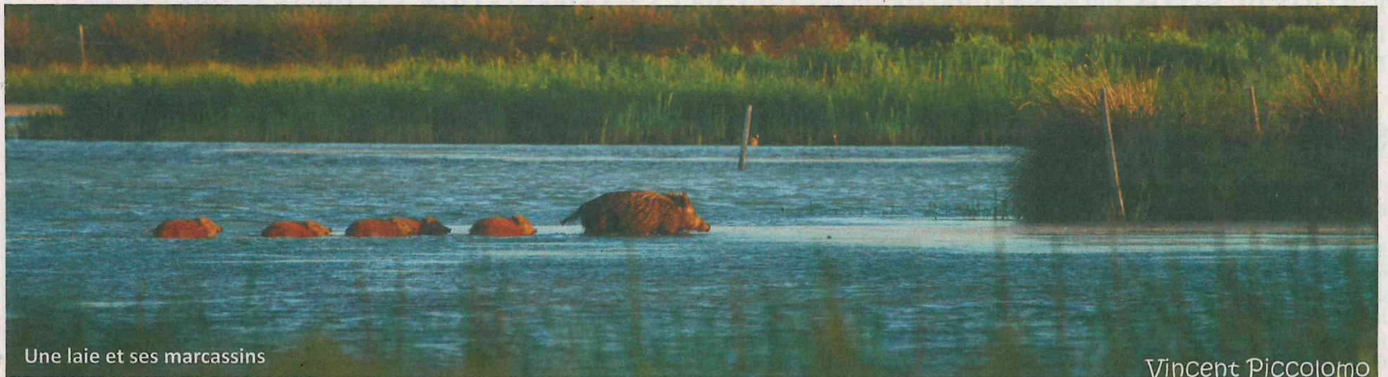
Une laie et ses marcassins