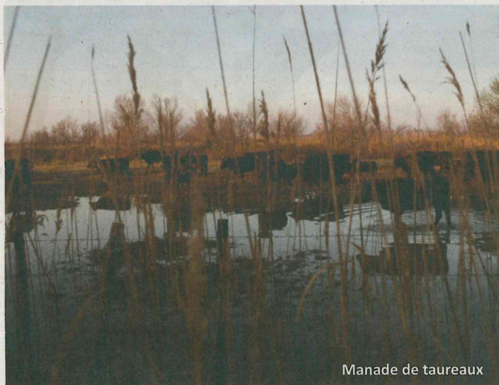
Manade de taureaux