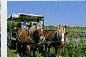
Les marais du Vigueirat ont su conjuguer tourisme, protection d'un site naturel et développement économique.