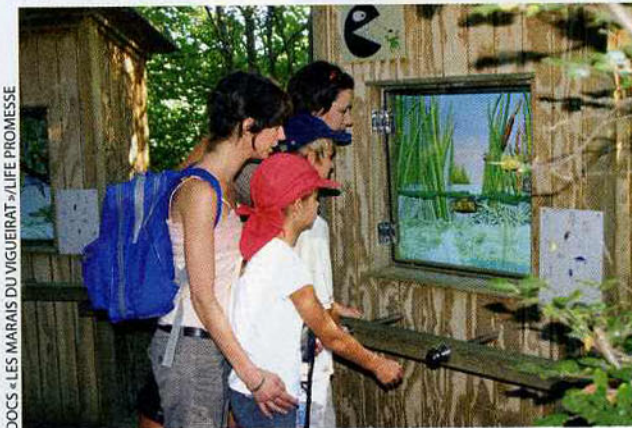
DOCS - LES MARAIS DU VIGUEIRAT - LIFE PROMESSE